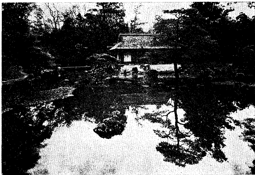
〔 日 本 の 庭 〕