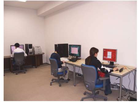
統計数理研究所オンサイト解析室